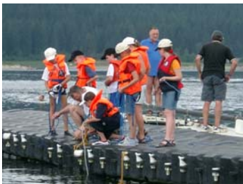
Vom Lehrsaal in die Praxis - wissen und Spaß im Verein vermitteln.

Inhalte der Ausbildung sind überfachliche Themen wie "Führen einer Gruppe", "Organisation von Veranstaltungen", "Einsatz von Spielen", "Aufsichtspflicht". Daneben werden fachliche Inhalte wie z.B. "Jugend- und Jüngstentraining im Verein", "Führen einer